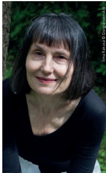
Ilma Rakusa