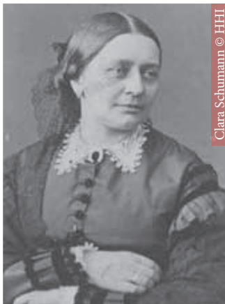
Clara Schumann