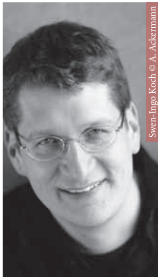
Sven-Ingo Koch