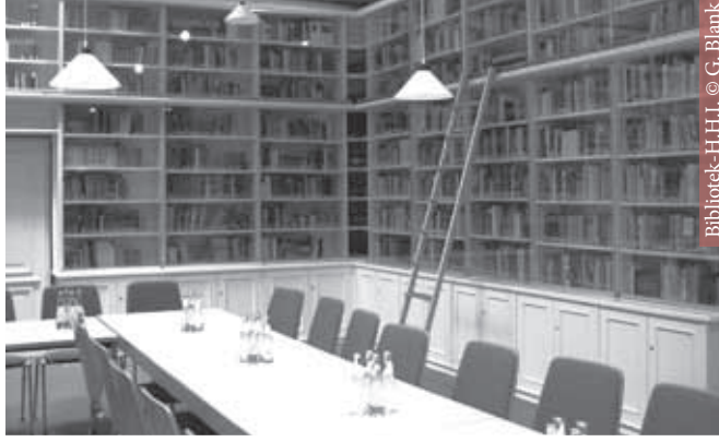
Bibliothek-H.H.I. © G. Blank