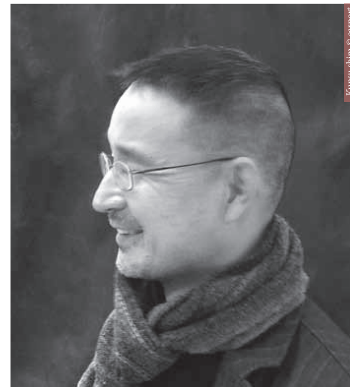
Kunsu shim © earport