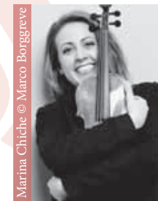
Marina Chiche

Do, 27. September, 19 Uhr/ Palais Wittgenstein