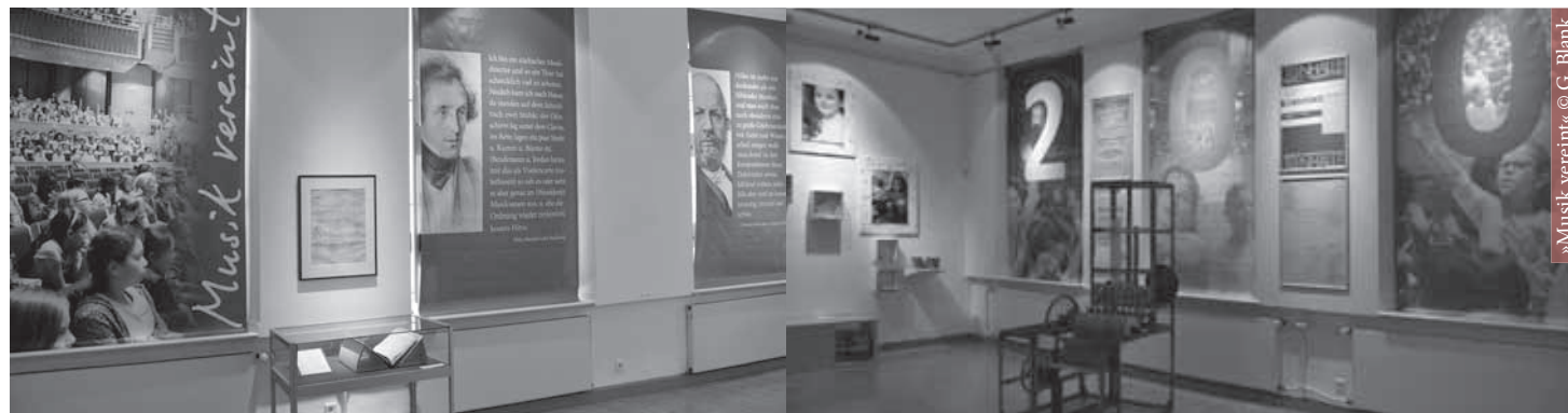
»Musik vereint«