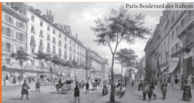
Paris Boulevard des Italiens

Veranstalter: Heinrich-Heine-Institut und Literaturbüro NRW