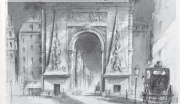
Rolf Escher: Porte St. Denis bei Heines Einzug in Paris