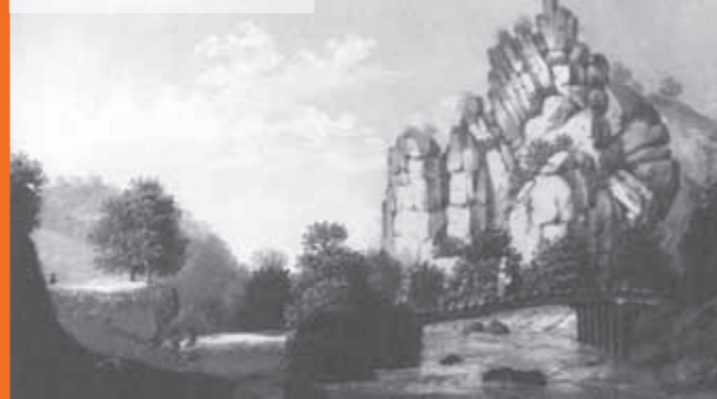
Unbekannter Künstler, [Ilisenstein im Harz]. Guache, o.J. Bilderschau im Heine-Institut

Hinweis: Voranmeldungen sind nur für die ausgewiesenen Veranstaltungen möglich unter der Telefon-Nr. 0211.89-95571 (Mo-Fr: 11-17 Uhr). Die Kasse im Eingang des Heine-Instituts, Bilker Straße 14, öffnet jeweils eine Stunde vor Veranstaltungsbeginn. Das Museum des Heine-Instituts ist zur Zeit wegen Renovierungsarbeiten geschlossen.