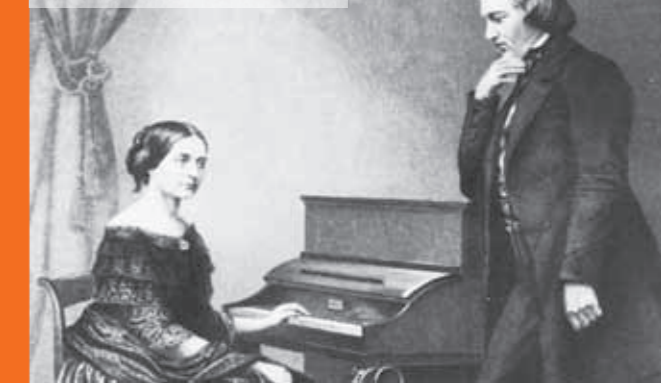
Clara und Robert Schumann Blick in die Schumann – Gedenkstätte

Hinweis: Voranmeldungen sind nur für die ausgewiesenen Veranstaltungen möglich unter der Telefon-Nr. 0211.89-95571 (Mo-Fr: 11-17 Uhr). Die Kasse im Eingang des Heine-Instituts, Bilker Straße 14, öffnet jeweils eine Stunde vor Veranstaltungsbeginn. Das Museum des Heine-Instituts ist zur Zeit wegen Renovierungsarbeiten geschlossen.