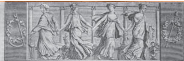
Heinrich Heine: Ueber Polen

Nur mit Anmeldung: Tel. 0211-8995571, Email hhi-hhg@t-online.de Veranstalter: Heinrich-Heine-Institut und Heinrich-Heine-Gesellschaft