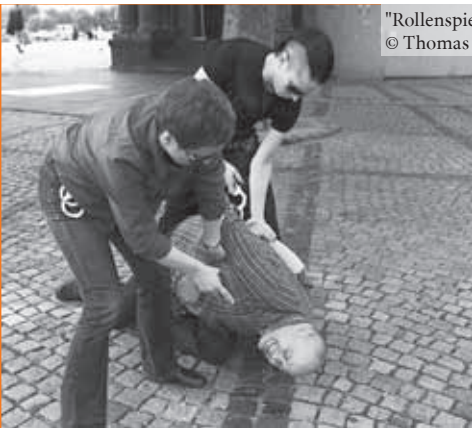
„Rollenspiele“ Martin Conrath

Alle Veranstaltungen im Rahmen der 3. Düsseldorfer Literaturtage finden statt mit freundlicher Unterstützung des Kulturamtes der Landeshauptstadt Düsseldorf.