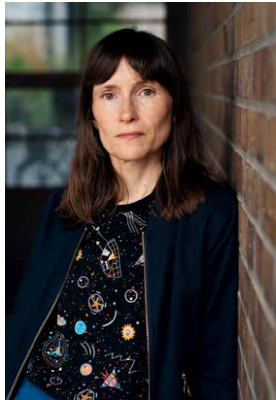
Heike Geißler

Eine Veranstaltung des Heinrich-Heine-Instituts.