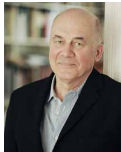
Hanns Zischler

Eine Veranstaltung im Rahmen der Kooperation Heine@Schumann von Heinrich-Heine-Institut und Robert-Schumann-Gesellschaft Düsseldorf