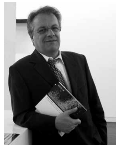
Bruno Kehrein © Privat

Eine Veranstaltung des Heinrich-Heine-Instituts in Kooperation mit dem VS-NRW, Gruppe Region Düsseldorf und mit freundlicher Unterstützung der Droste-Verlagsgruppe.