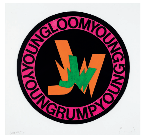
Ferdinand Kriwet, Button 11, 1967

Bis Sonntag, 9. Januar 2022, Heinrich-Heine-Institut